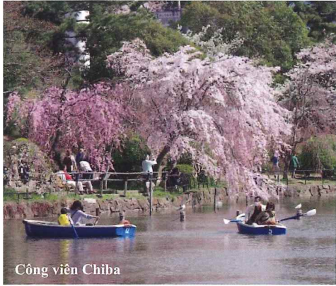
Công viên Chiba

Học viện Quốc tế Wisdom tọa lạc tại thành phố Chiba, là trung tâm chính trị, kinh tế và văn hóa của tỉnh Chiba, bên cạnh thủ đô Tokyo. Đây là một nơi thuận tiện để di chuyển. Từ ga Hamano Bạn có thể đến Tokyo trong vòng chưa đầy một giờ và 10 phút đi tàu đến Ga Chiba nằm ở trung tâm của Chiba nơi mà xung quanh có các trung tâm thương mại, sân bóng đá, bãi biển và công viên giàu thiên nhiên, mang lại môi trường sống lành mạnh. Ở Chiba, các lễ hội được tổ chức vào mùa hè và mùa thu hàng năm và Học viện Quốc tế Wisdom cũng tham gia như một phần của hoạt động giao lưu quốc tế.