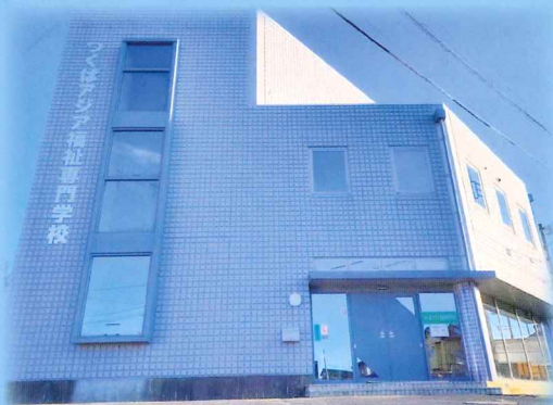
Học Viện pháp nhân Kokiso Trường cao đẳng phúc lợi Châu Á Tsukuba