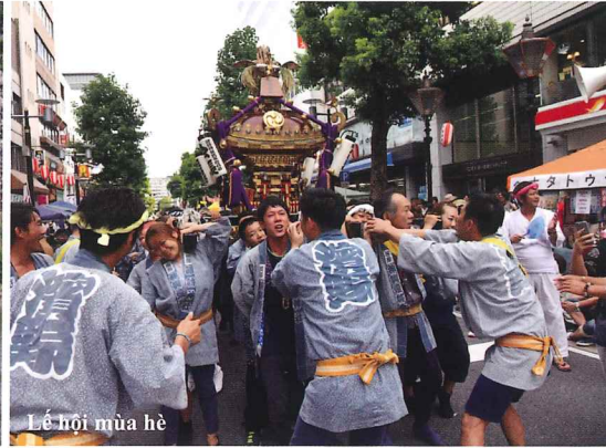
Lễ hội mùa hè