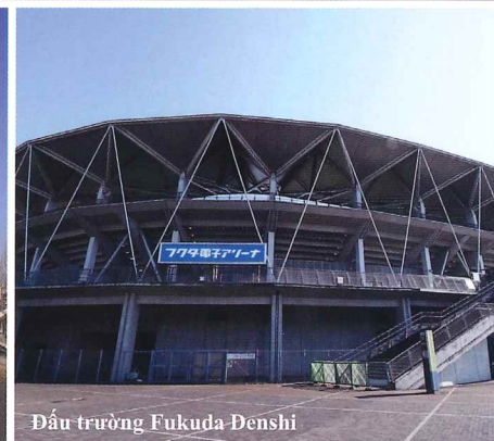
Đấu trường Fukuda Denshi