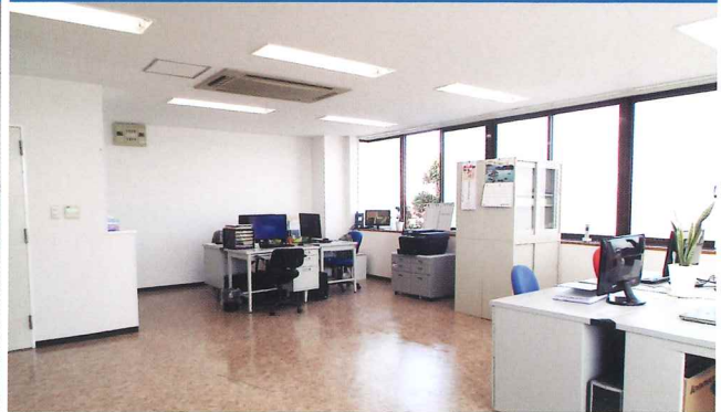
Phòng giáo vụ

Lúc nào cũng có giáo viên nhiệt tình, có thể trao đổi các vấn đề trong cuộc sống