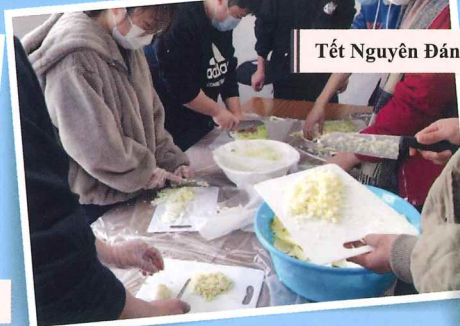
Tết Nguyên Đán