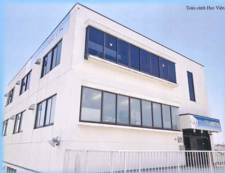
Toàn cảnh Học Viện