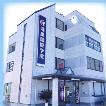
Học viện quốc tế Konosu