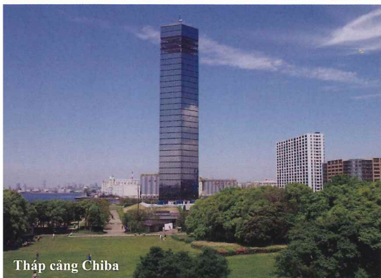
Tháp cảng Chiba