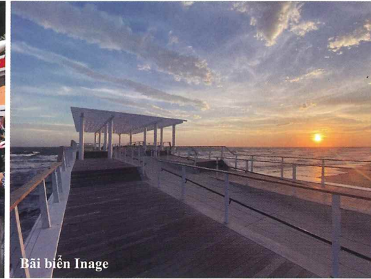
Bãi biển Inage