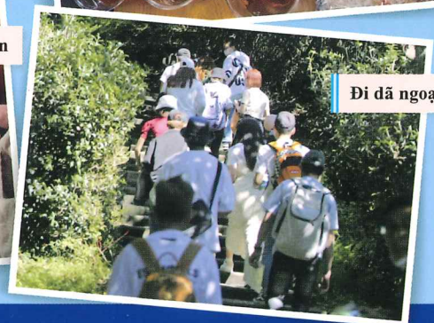
Đi dã ngoại