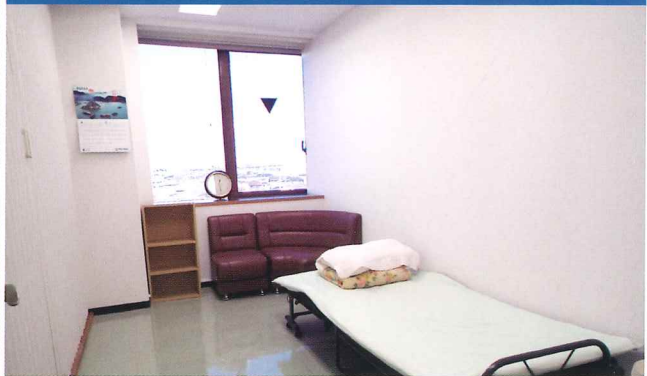
Phòng y tế

Có thể nghỉ ngơi khi tình trạng sức khỏe không tốt